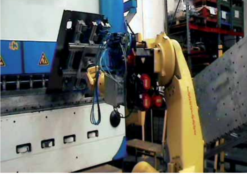
AVG installato su robot per l'asservimento di una pressa.

ad insufflare aria nei generatori di vuoto in servizio.