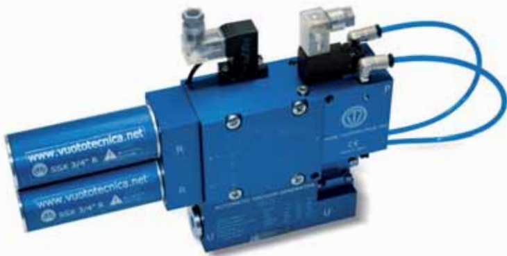
Gli AVG sono disponibili in due versioni con portate di 18 e 25 m 3 /h e un grado di vuoto dell'85%.