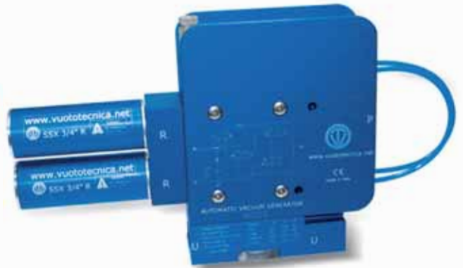
AVG con protezioni contro gli urti o le cadute accidentali.

nergetico, vero segreto di questi generatori.