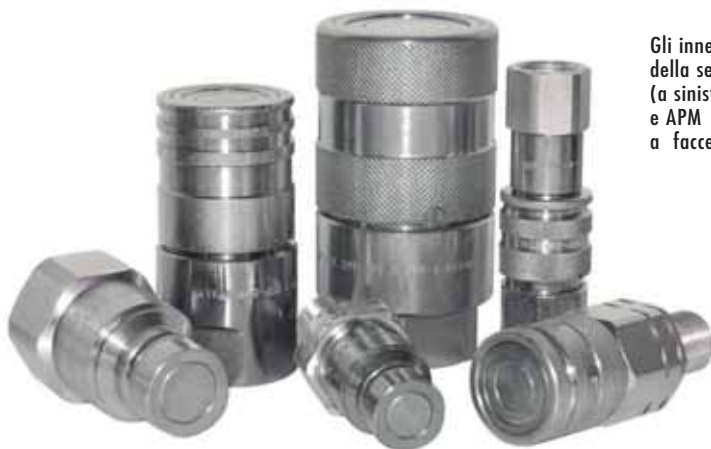
Gli innesti della serie A (a sinistra) e APM a facce piane.