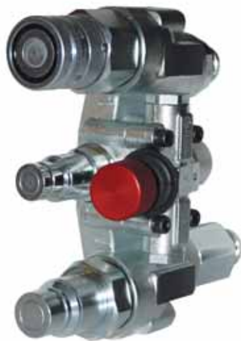
Saturn Block è la soluzione per rispondere alle esigenze delle moderne macchine operatrici.

un network di fornitori importanti, con cui ha stretto forti legami negli anni. Si tratta di una scelta precisa in funzione dello sviluppo. "I nostri innesti - ha sottolineato Stucchi - si caratterizzano per la semplicità d'uso e per il valore aggiunto che cerchiamo di dare al prodotto. La progettazione avviene con moderni sistemi CAD tridimensionali. Collaboriamo con studi esterni per l'analisi FEM e CFD al fine di proporre agli utilizzatori componenti di qualità". La produzione invece si avvale di moderne macchine utensili a CNC.