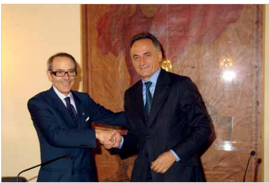
Roma, June 2007: The Presidents of both SIAE and AldA at the unveiling of the industrial property protection project. Roma, giugno 2007: il presidente Siae e quello di AldA alla presentazione del progetto di tutela della proprietà industriale.

"The project is at the conclusive stage, we have lost parts along the way but in the end we managed to stick to our intentions. The merit is shared with Centrobanca which managed to co-ordinate everything and helped us, thanks to experts, in preparing the documents needed to make major