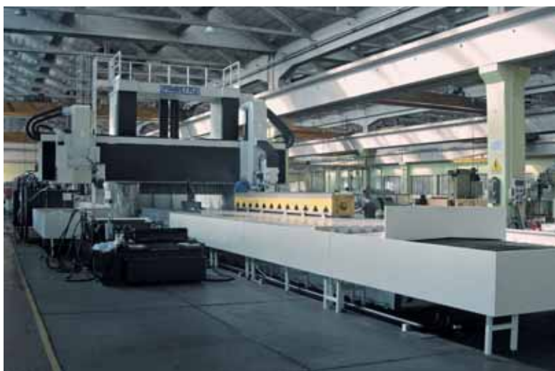
Rettificatrice Favretto Fmt (tipo Tup).

Entrambe le persone sul piano di lavoro della tavola indicano la misura delle dimensioni della macchina.