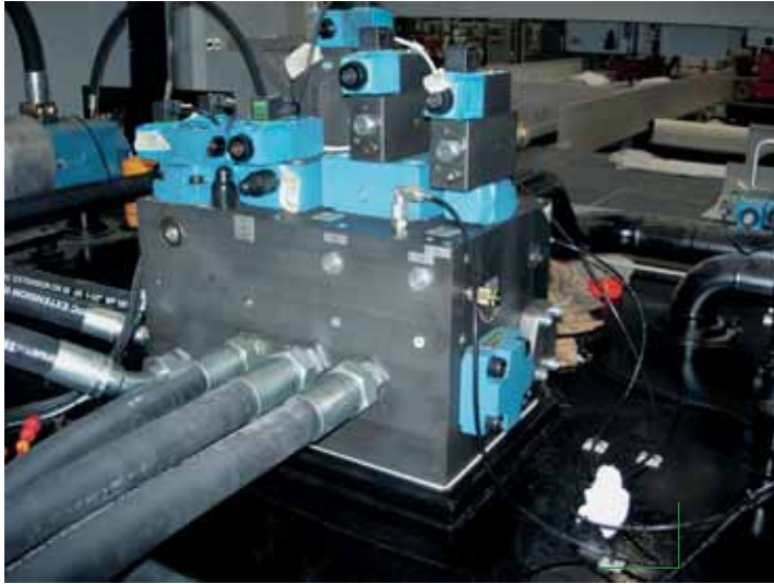
Collettore con valvole per il monitoraggio della pressione e della portata (valvola integrata e Valvistor).

se di registrazione e messa a punto in modo da poter ottenere un risultato soddisfacente. Questo può avvenire anche grazie al supporto tecnico offerto dal personale Eaton che in collaborazione con i tecnici Favretto Fmt ha consentito di ottenere risultati soddisfacenti, in modo particolare nella delicata fase di inversione del moto della tavola.