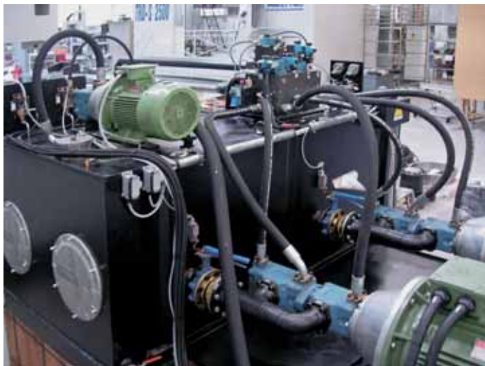
Una power unit con una capacità di serbatoio di 2.500 litri, che aziona la rettificatrice Favretto Fmt.