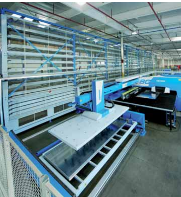
Il modello SG Night Train di Finn-Power.

“Abbiamo subito iniziato a favorire scambi tecnologici fra il nostro personale di Ricerca e Sviluppo, in modo che le competenze delle due aziende non restino isolate. I nuovi progetti sicuramente trarranno vantaggio da questa sinergia”.