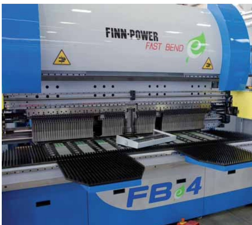
La Fast Bend di Finn-Power.

Le due società hanno diverse filiali sparse nel mondo. In molti Paesi vi è una filiale Prima Industrie e una Finn-Power. Rimarranno entrambe o ci sarà un processo di raggruppamento Paese per Paese?