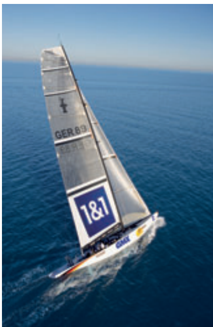
Sul GER '89, lo yacht con cui la squadra tedesca United Internet Team ha partecipato alla America's Cup, sono stati utilizzati i film Aptiv della Victrex per proteggere le parti maggiormente sottoposte a stress. I film Aptiv sono stati scelti per l'estrema resistenza alla corrosione e sono stati applicati sullo scafo e sulle parti sotto-coperta per fornire una protezione dalla frizione e dalle pressioni derivanti dalla velocità di navigazione.

Caricati e non nella versione Peek-HT e rinforzati con vetro, questi gradi sono approvati per l'utilizzo nelle lavorazioni alimentari e altre applica-