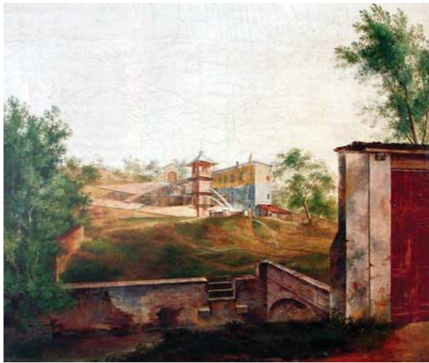
Laboratorio delle esperienze idrauliche alla Parella (1765).

Politecnico è parola che viene dal greco: polùs e téchne (= molte tecniche) e trovò uno dei suoi primi usi linguistici come neologismo alla fine del XVIII secolo in Francia durante la Rivoluzione. Il Tresor de la Langue Française alla voce "polytechnique" scrive che questo aggettivo, riferendosi alle istituzioni designa un «établissement dove si insegnano più discipline». In particolare l'École polytechnique fu l'istituzione fondata in seno al Ministero degli Eserciti francese dove erano formati gli ingegneri della pubblica amministrazione e gli ufficiali delle armi specializzate. In realtà questa "scuola" fu fondata l'11 marzo 1794 con il nome di École centrale des travaux publics (vedi: Choix de rapports, opinions et discours prononcés à la Tribune Nationale , t. 15, p. 283) e solo l'anno successivo prese questo nome (vedi: Mém. sur l'École centrale