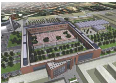
Progetto della Cittadella Politecnica (2006).