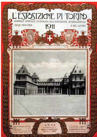
Esposizione del 1911.