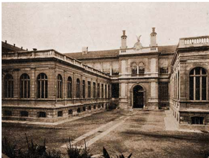
Museo industriale (1864).