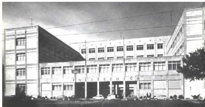
Nuova sede in Corso Duca degli Abruzzi (1958).