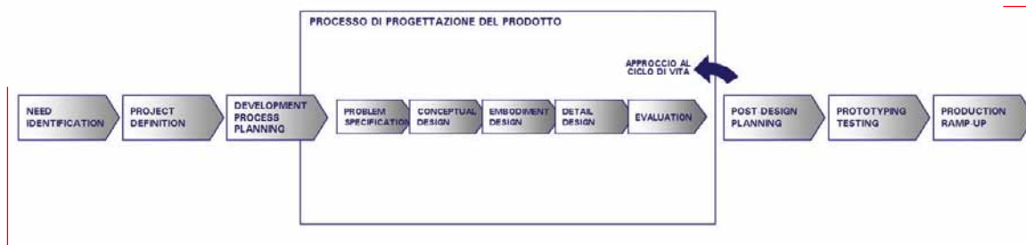
2. Schema delle fasi dello sviluppo prodotto.

che condizionano l'impostazione preliminare del progetto, includendo oltre alle richieste del consumatore e alle opportunità di mercato anche le necessità ambientali, e dando a queste ultime il dovuto peso nella definizione di requisiti di prodotto e strategie aziendali.