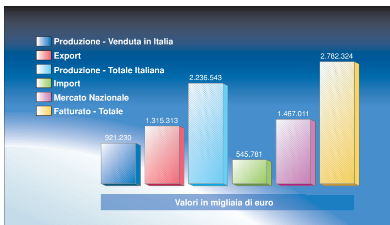
Dati statistici globali 2004 (valori in migliaia di euro).

Nonostante la forza dell'euro e la concorrenza dei Paesi emergenti, il prodotto italiano del comparto delle trasmissioni meccaniche è fortemente richiesto all'estero. Si conferma quindi la fusione di due componenti importanti che determinano la scelta del prodotto italiano da parte dei clienti stranieri e cioè l'alta qualità e un prezzo competitivo al quale si deve aggiungere un sempre maggiore servizio dell'industria italiana, servizio che si manifesta anche e sempre più in fase di progettazione.