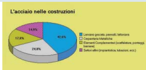
Ripartizione del consumo di acciaio destinato alle costruzioni in Italia. Il consumo annuale si attesta attorno ai 4 - 5 milioni di tonnellate