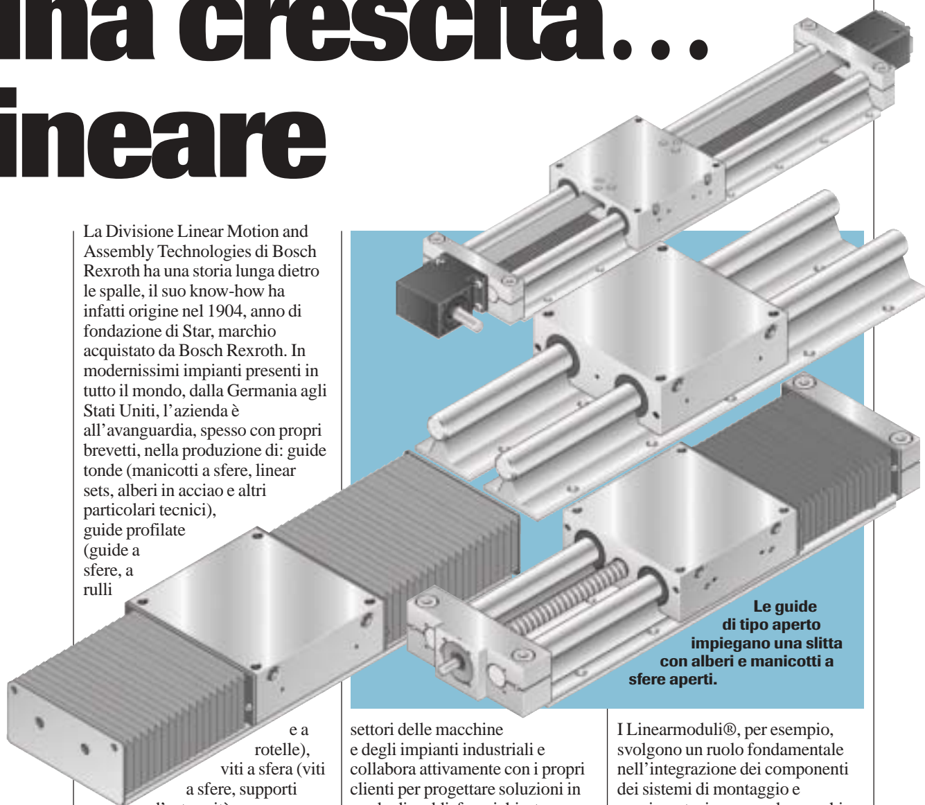
Le guide di tipo aperto impiegano una slitta con alberi e manicotti a sfere aperti.

I Linearmoduli®, per esempio, svolgono un ruolo fondamentale nell'integrazione dei componenti dei sistemi di montaggio e movimentazione e per le macchine per imballaggio. I sistemi lineari Rexroth, inoltre, vengono ampiamente utilizzati per le macchine per lavorazione del vetro, del marmo, del legno e della lamiera; per le macchine da taglio al plasma, waterjet, ossitaglio,