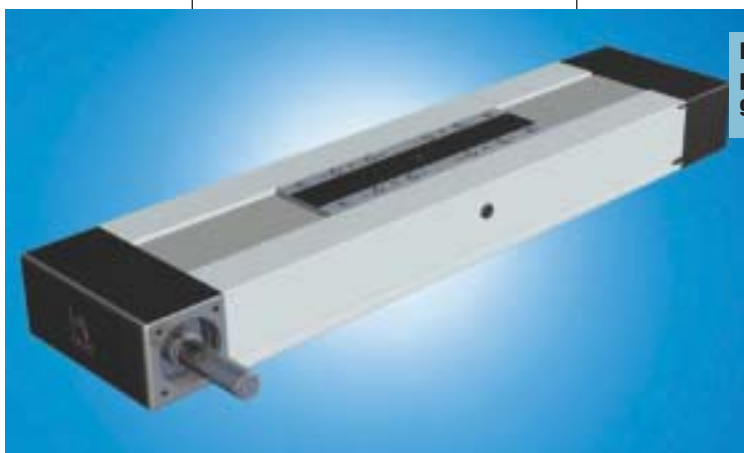
Il modulo compatto CKR a cinghia dentata.