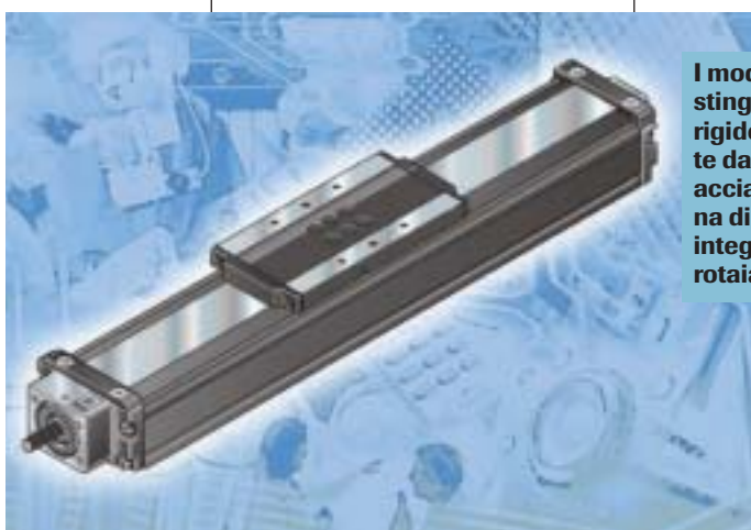
I moduli PSK si contraddistinguono per l'estrema rigidità e precisione fornite da una struttura di base in acciaio con superficie interna di riferimento e sistema integrato di guide a sfere su rotaia.

TKL, consente di adattare questo componente a molteplici applicazioni. Le tavole sono composte dal corpo (base in acciaio o