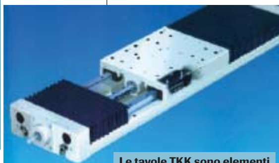
Le tavole TKK sono elementi di grande precisione di dimensioni compatte pronte all'installazione.