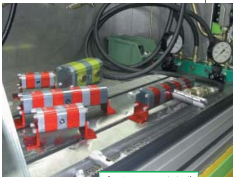
Alcuni componenti Vivoil al banco di collaudo.

«Il portafoglio dei prodotti Vivoil è molto diversificato –ha commentato Guglielmo Alberto, responsabile tecnico– produciamo tutte le gamme di divisori di flusso, motori, pompe singole e multiple dal gruppo 0 al gruppo 2 e prosimamente anche il gruppo 3. Grazie alla modularità dei nostri prodotti e alla flessibilità produttiva riusciamo a sod-