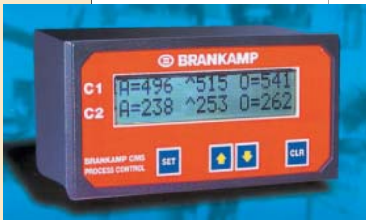
Dispositivo CMS per il monitoraggio delle collisioni.

Registrazione dello sforzo esercitato da una collisione non protetta in un centro di lavoro.