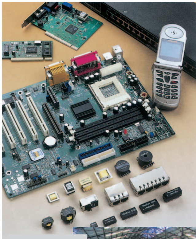
Alcuni settori produttivi presenti a Xiaolan.