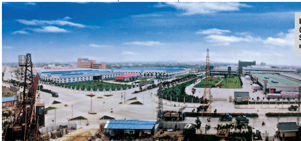
La zona industriale di Xiaolan (National Enterprises Technical & Scientific Garden Area) fondata nell'anno 2000.

Xiaolan, inoltre, è ricca di aziende specializzate nei settori meccanico (minuterie metalliche, serrature, componentistica), elettronico (audio e video), chimico, plastico, dell'abbigliamento, ecc. Nel 1986 Xiaolan è stata definita la 'città della serratura della Cina del Sud' grazie alle numerose imprese specializzate in questo ramo della meccanica anche se l'area è popolata da più di 4.500 aziende che producono oltre 300 categorie merceologiche differenti.